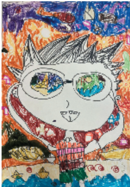
▲周梓铤(杭州市富阳区天河富春湾幼儿园) 我眼中尽是绿水青山 指导老师:周宇阳 人物形象简洁明了,线条大胆流畅,色彩搭配和谐。通过卡通人物的表情姿态与穿插在其身后的绿水青山,我们可以感受到一种阳光欢乐自然和谐的氛围。