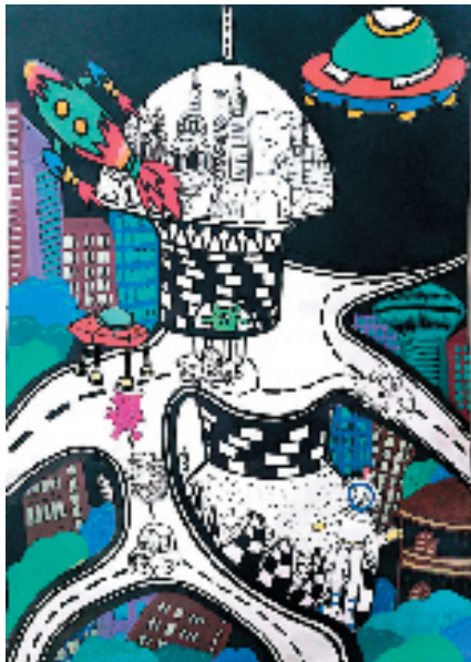
▲玉再伊尔·木太力甫(维族学生)(温宿县第三中学) 科幻画 指导老师:俞静(援疆教师) 作品构图独特,将城市建筑物、道路、飞碟、飞行器和宇航员等元素巧妙地组合在一起,形成了具有吸引力的画面,这种构图方式体现了小作者的创意和想象力。