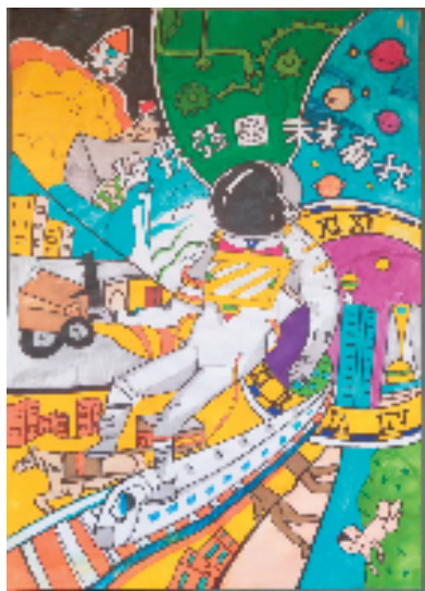
▲阿依祖丽娜尔·阿巴拜克热(新疆维吾尔自治区阿克苏地区温宿县第三中学) 强国梦 指导老师:安外尔·艾拉 作品以宇航员为中心,将画面进行块面分割,小作者对每个星球和场景都进行了精细的描绘,让人们能够感受到宇宙与现实的多样性和丰富性。