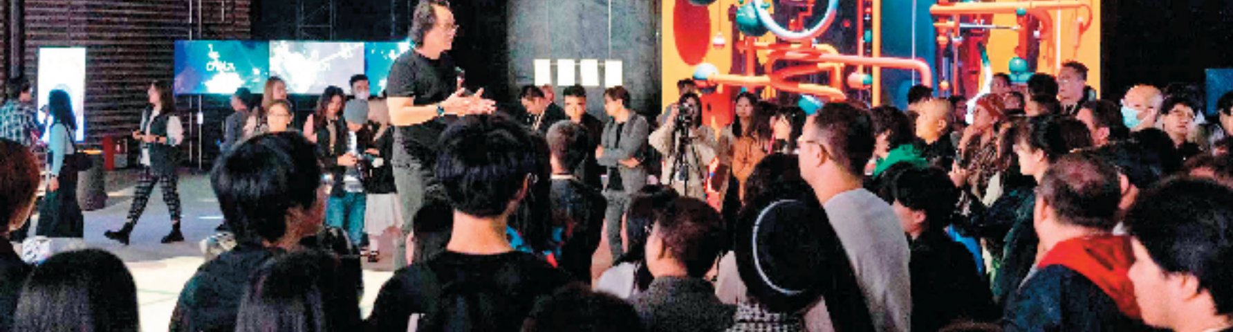
“向达·芬奇提案——上海科技艺术大展暨第七届国际跨媒体艺术节”开放媒体单元展览现场

引言:科技和艺术曾经是同一个话题,而不是两个领域。在10月29日至11月13日的16天展期内,中国美术学院跨媒体艺术学院驱动全新的开放界面,通过艺术创作、学术论坛和展演项目汇聚一个时代的创造性能量,邀请达·芬奇来到21世纪,共同思考当今艺术与科技背后的人类时代命题。本期邀请艺术界及跨学科的专家学者谈谈什么是科艺融合、以及艺术如何跨学科发展。希望以艺术与科技为媒介的展览,能为观众带来广泛的艺术视野和独特体验,为各界提供广阔的思考和创作空间。