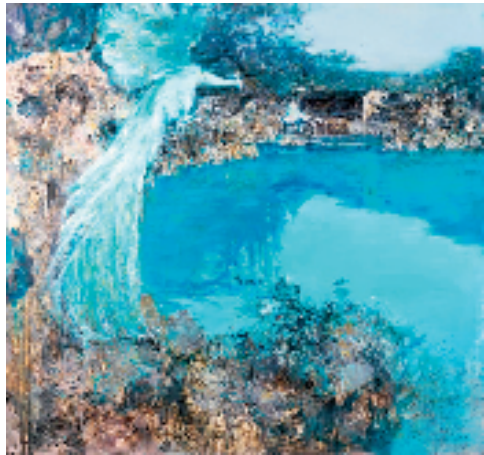
黄礼攸 记忆·家园 180×190cm