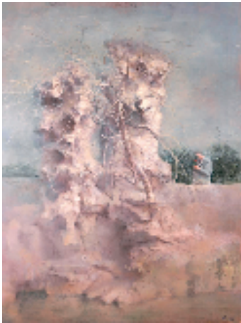
何军 闻香 200×150cm

本报讯 通讯员 黄禾 10月28日，“诗意江南——中国油画作品展”在尹山湖美术馆开幕。此次“诗意江南”聚焦油画的艺术表现形式，探讨江南文化传统和当代油画艺术的演进，展示当代中国美术事业的繁荣与发展。杨飞云、闫平、王琨、张淳、赵培智、陈世宁、陆庆龙、张杰、张冬峰、何军、黄礼攸这11位著名油画家与来自全国各地的100位艺术家，共同以多样化的艺术语言、艺术样貌描绘江南胜景，讲述江南故事，呈现一场盛大的艺术盛会和别样的诗意江南。