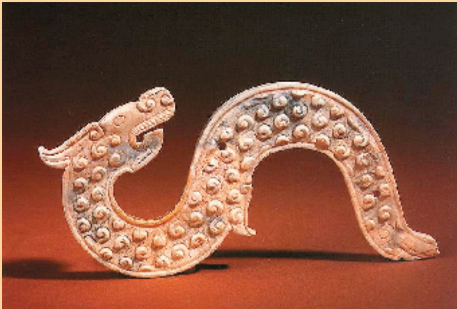
战国 白玉龙形佩 故宫博物院藏