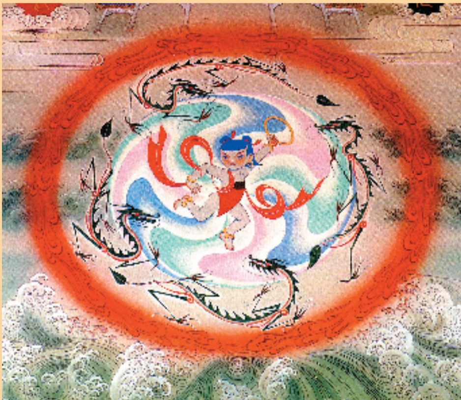
张仃 哪吒闹海 首都机场壁画局部 1979年