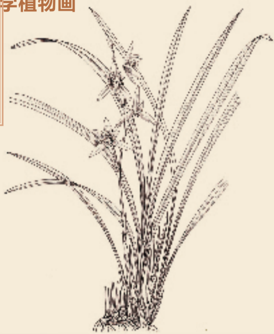
孙英宝 建兰 墨线图