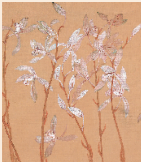
明暗变化的白色花朵

古代: 建兰的栽培历史有1000多年,宋代就很繁盛。建兰的品种繁多,每年可以开两次花。从流传至今的“银边大贡”等建兰的品种名称可以得知,在历史上建兰曾是炙手可热的奇花逸品,曾作为贡品进献朝廷,普通人很难欣赏到。比如,宋太祖赵匡胤就非常喜欢建兰,他曾下旨每年由福建、岭南广东等地进贡建兰名品入宫。到了清朝,无论是在皇宫还是在市井民间,都以栽培建兰为时尚,慈禧太后也曾亲笔画过建兰。