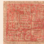
伯谦所见书画 铭心绝品