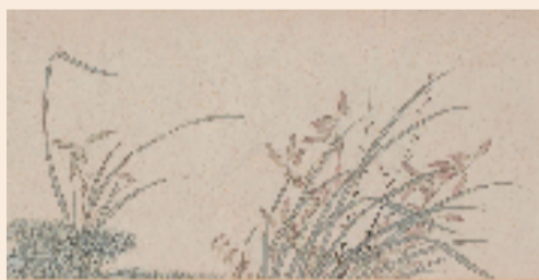
明 马守贞 芝兰图(局部)