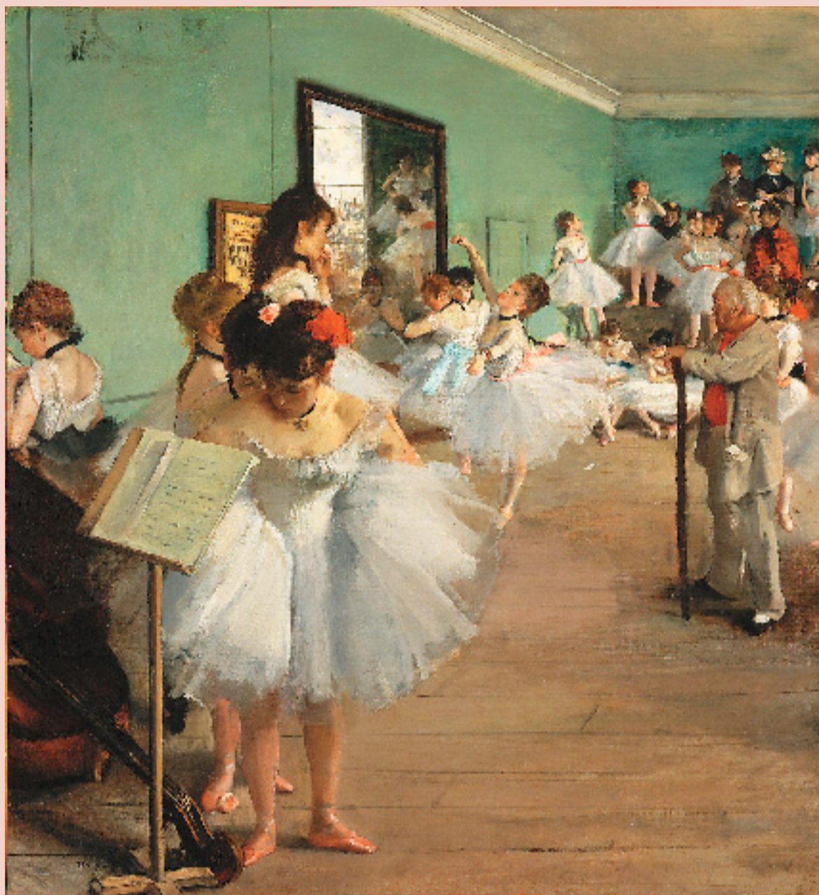
埃德加·德加 舞蹈教室 83.5x77.2cm 布面油画 1874年 大都会艺术博物馆藏