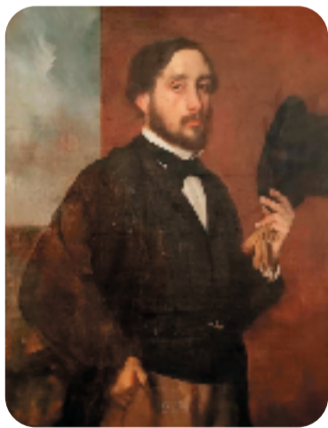
埃德加·德加 (E.Degas 1834—1917)

埃德加·德加，法国画家、雕塑家，被认为是印象派的领军人物，但是他不像莫奈、雷诺阿是百分之百的印象派，他融合了印象、古典、现实主义和浪漫主义画派的多种风格。他也是印象派创始人中唯一有在美术学院接受过正规训练的画家。德加出生于巴黎的资产阶级家庭，祖父是个画家，所以他从小便生长在一个艺术的环境里。他也遇到了一个好老师——安格尔。