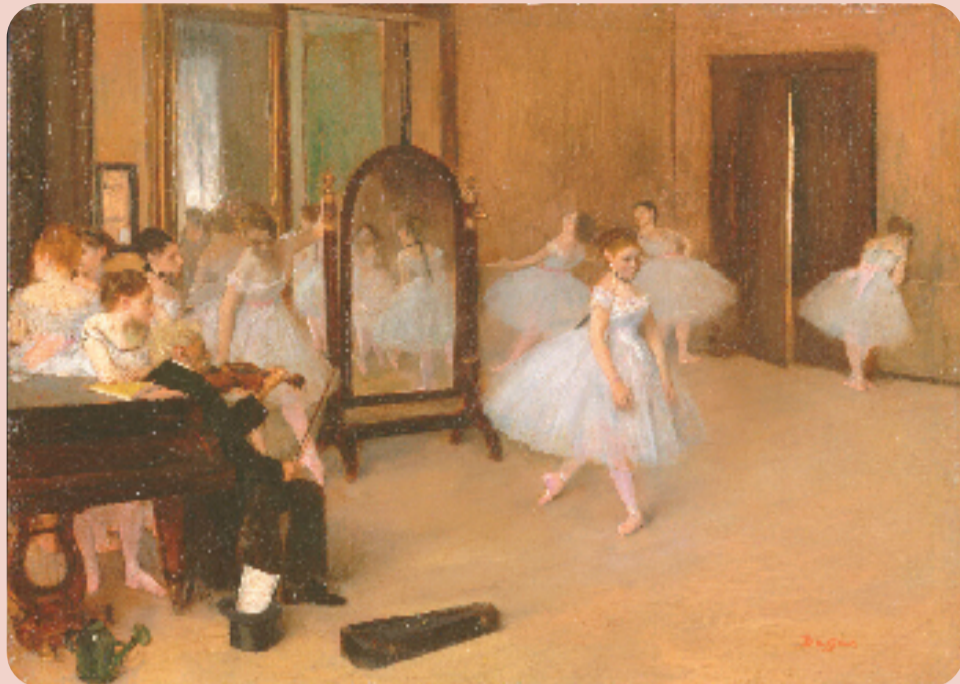
埃德加·德加 舞蹈班 板面油画 约1870年 大都会艺术博物馆藏

《舞蹈教室》这幅画是德加芭蕾舞女画中较有代表性的一幅。教室里拥挤不堪，德加没有表现舞者在台上灵动起舞，而是表现了她们一点也不优雅的样子。在众多的少女中站着个白发长者——于勒·佩罗，拄着拐杖，正在审查一个少女的表演，而其他舞者都在休息或做准备工作，有人把手伸进裙子里整理衣服，有人正在咬手指，有人在调整肩带，有人叉开双腿一屁股坐在凳子上，有人靠在墙边心不在焉，有人歪着脖子……二十几个少女动作神态不一，但个个紧张的情绪一览无余。