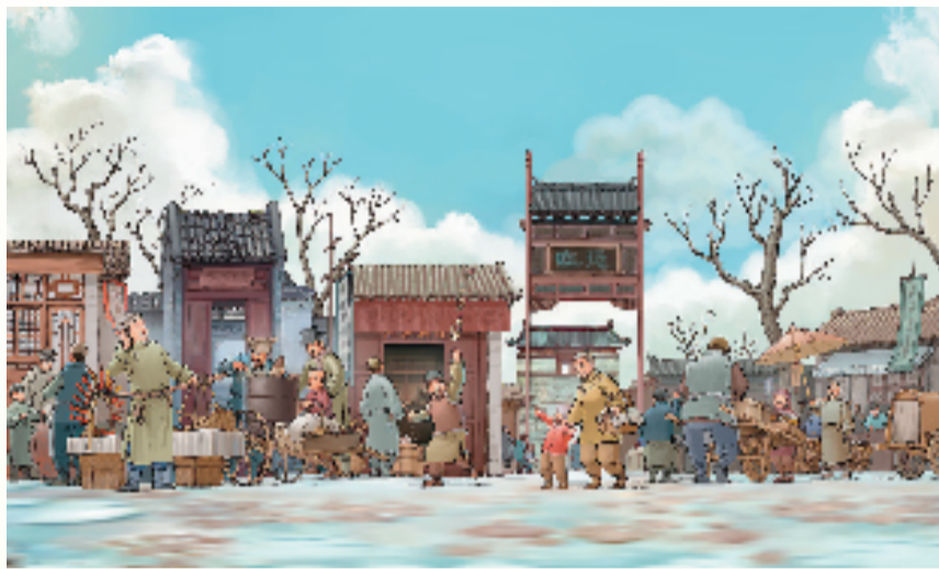
林敏/绘制《水上漂来的北京城》选页

如今越来越多的家庭开始注重儿童教育,购买儿童读物和绘本已经成为日常的需求,这促进了绘本在中国的流行和发展。优秀出版社、绘本画家、推广人的大量涌现,“中国绘本展”这样的大型活动,助推了中国原创绘本的飞速发展。