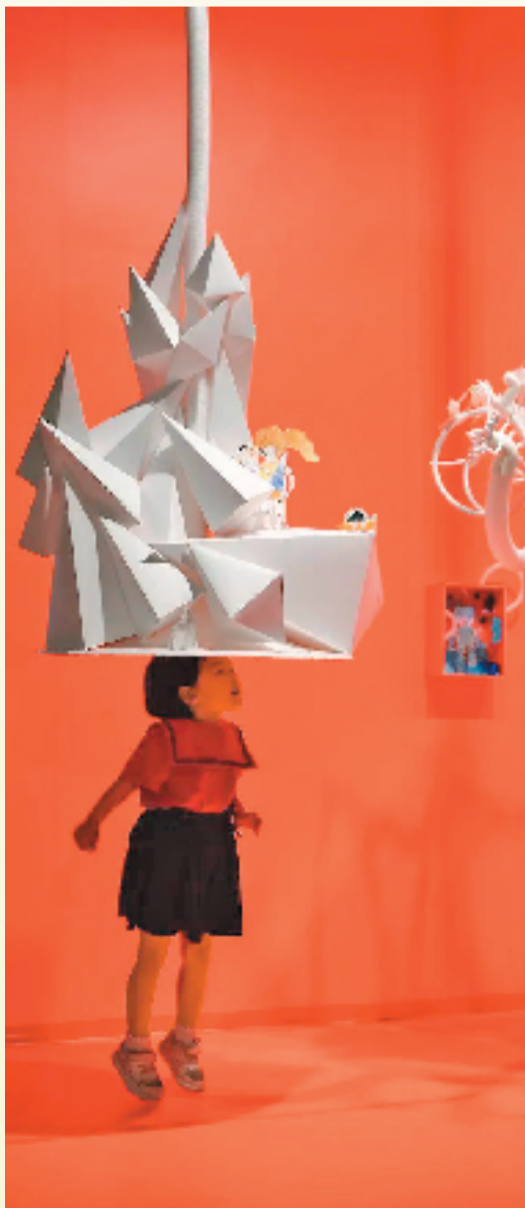
《帽子上的奇遇》展览现场

面对未知,孩子往往是最勇敢的探险者,灵光在清澈的眼眸中一闪,这些问题便拥有了无数可能的回答。