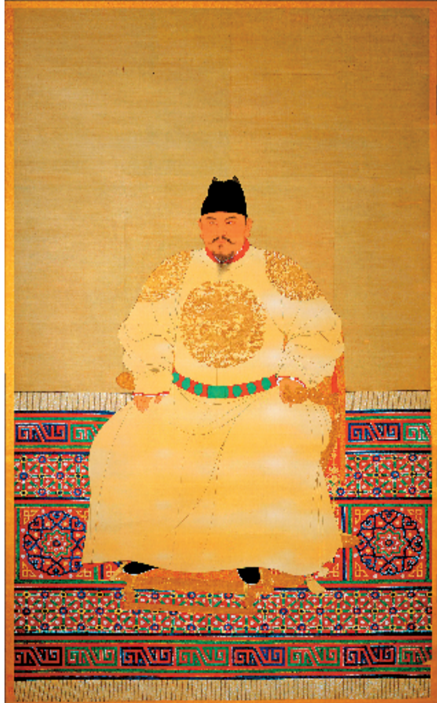
明太祖皇帝像 南熏殿旧藏

清代皇帝龙袍属于吉服范畴,比朝服、袂服等礼服略次一等,主要用于重大吉庆节日以及先农坛皇帝亲耕等场合。清皇帝龙袍,绣有九条龙(有一只是被绣在衣襟里面)。从正面或背面看,只能看到五条龙,九五之数象征帝王九五之尊的地位。