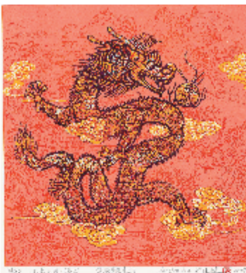
郑建辉 山水之间·腾龙 30x28cm 绝版套色木刻

本报讯 通讯员 颜雪晴 “江苏大剧院贺岁版画展”是江苏大剧院在跨年之际,以“迎春”为主题举办的年度版画展览,组委会每年邀请“青春飞扬·中国青年版画家提名展”参展版画家和国内优秀中青年版画家参与展览主题创作。今年已征集来自全国的130位版画家的贺岁版画作品近160件,于1月30日至3月31日在江苏大剧院举办。自2021年以来,主办方已连续举办3届,每年元旦及春节期间以“展览+销售”模式在江苏大剧院共享大厅呈现。2024年是中国传统文化十二生肖中的龙年,龙是中国古代传说中的瑞兽,是中华民族的象征,龙文化形成了强大的民族凝聚力,同时铸就了包容、善良、智慧、勇敢的龙族精神,炎黄子孙都以自己是“龙的传人”而倍感自豪。此次活动为新春佳节增添喜庆祥和的“艺术年味”的同时,也为广大艺术爱好者们献上一份独特的新年祝福。