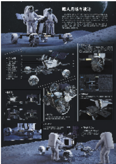
金龙 杨承颖 梁炯光 陈华 载人月球车设计 艺术设计-工业设计

本报讯 通讯员 傅健雯 4月26日,由中共重庆市委宣传部、重庆市文化和旅游发展委员会、重庆市文联、重庆市美协共同主办的“向人民汇报——庆祝中华人民共和国成立75周年第九届重庆市美术作品展览暨第十四届全国美术作品展览重庆送选作品展”在重庆当代美术馆开展。重庆市文联党组书记、副主席陈若愚宣布展览开幕。开幕式由中国美协理事、重庆市美协副主席兼秘书长魏东主持。