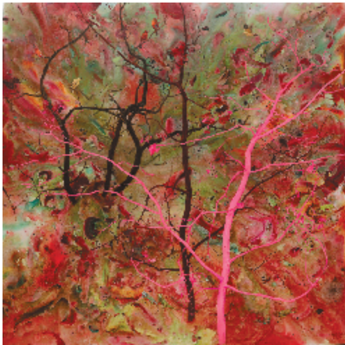
王朝刚 黄琳珺 知觉的森林-春风化雨 油画