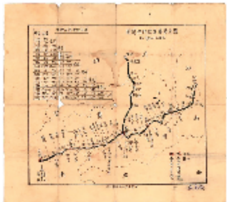
1938年,国立艺专从湘西沅陵至昆明的迁校行程简图(卢是旧藏)

这一时期写生稿呈现朴拙之风;如果将之与1923年描绘北京西便门外的风景画相比,则可看出两者风格的联系,体现了刘开渠的“粗笔画风”。上述两件风景速写,以景取胜,至于笔墨技法、形象造型等方面不甚考究。后来,刘开渠借此次写生稿,创作了另一件设色速写稿。该稿分为近、中、远三个部分,近景为一座矮山之顶,四间黑瓦白墙的房屋坐落于山脚,造型规整,错落有致。绿草如茵的水岸边,停泊数只红色帆布的渔船。湖面,几艘船扬帆而行,热闹非凡。湖面两侧及远处,矗立高耸的山峰,壁立千仞,与直立的桅杆构成一致向上的气势。山体均为彩墨设色,青山白云,浑厚华滋。画面的整体构图与主要形象,与上文两件速写稿有多处相似之处。但前者,具有了明显的时代风貌,特别是画面中红色的帆船,为画面增加了不少活力和朝气。风帆鼓相较于上述两件速写,要更加完整。