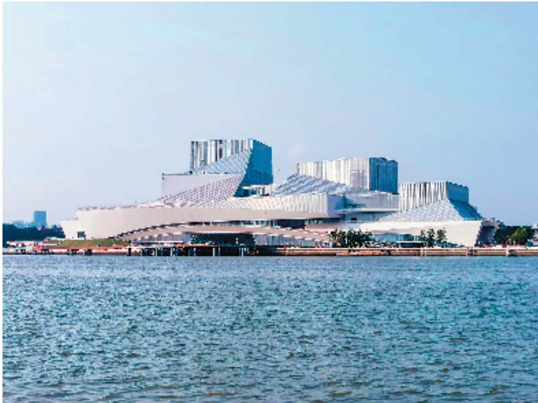
广东美术馆白鹅潭馆区