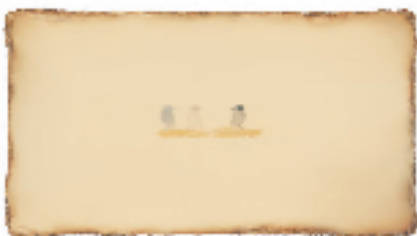
陈淑霞 道白 102x182cm 布面油画 2015年

花卉画稿之二 书芸说这是中国当代八位女艺术家的绘画作品汇展，不如说是一次美好之光、希望之光与理性之光的汇聚。参展的八位艺术家，大多出生于上世纪70年代，均受过多年专业美院的严格训练，在自己的艺术创作领域都建树颇丰。虽地域不同，但女艺术家们追求一致。她们以令人