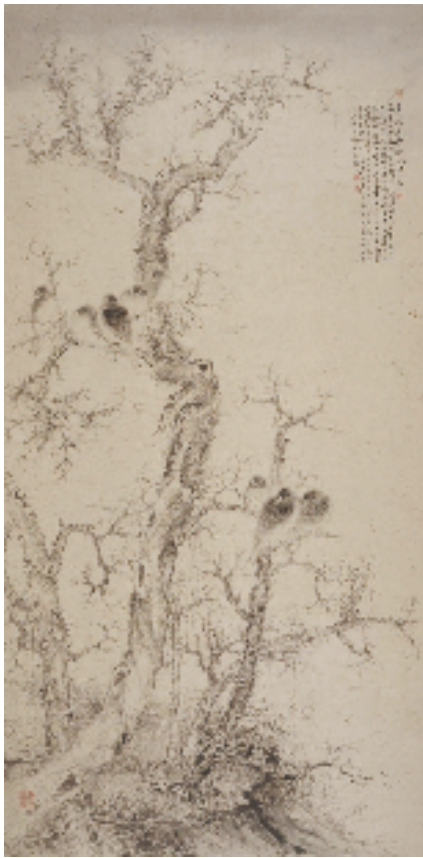
刘万鸣 太行真秋,气贯宇宙 300x140cm 纸本设色 2010年

文化和旅游部党组成员、副部长卢映川介绍了刘万鸣同志的工作履历,指出刘万鸣同志的任命是从中国国家画院领导班子建设实际出发,经过通盘考虑,慎重研究做出的重要决定。他对中国国家画院近年来的工作给予了充分肯定,并提出了以下四点希望:一是旗帜鲜明讲政治;二是坚持守正创新,争取各项工作再上新台阶;三是加强领导班子建设,形成团结奋斗的集体;四是加强全面管党治