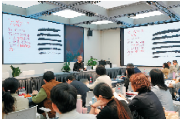
书法名师团师资选拔交流活动现场

今年的“蒲公英计划”中也有新意——上课的形式分两块:一是课堂示范,由蒲公英名师团的老师执教;二是课堂展示,19名面向全国选拔的蒲公英预备名师团成员来上书法展示课,由蒲公英名师团组成的评议团进行评审。同时,经名师团评议成员评为优秀课案例的老师,将被聘为蒲公英名师团成员。陈振濂对记者说,名师团的阵容进入这个团队,是层层选拔出来的,然后再