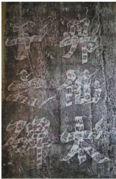
武则天 飞白书《昇仙太子碑》碑额 拓片