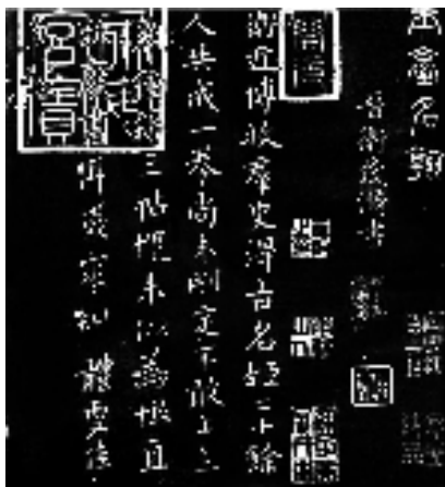
卫夫人 楷书《古名姬帖》拓片