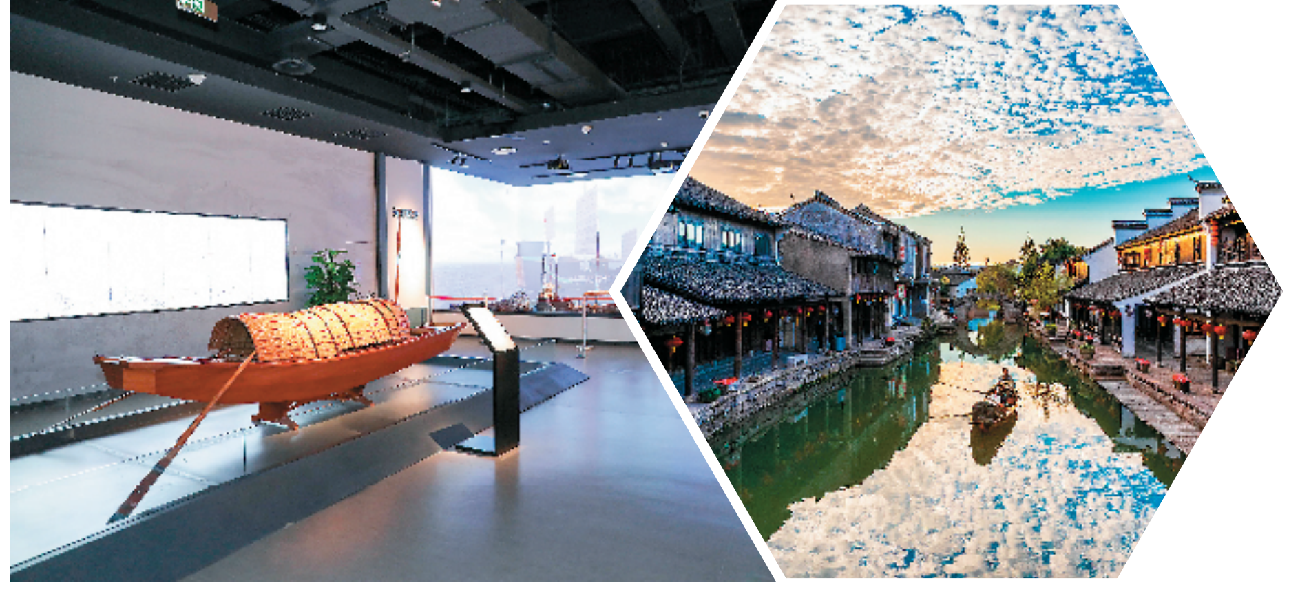
浙东运河博物馆内景