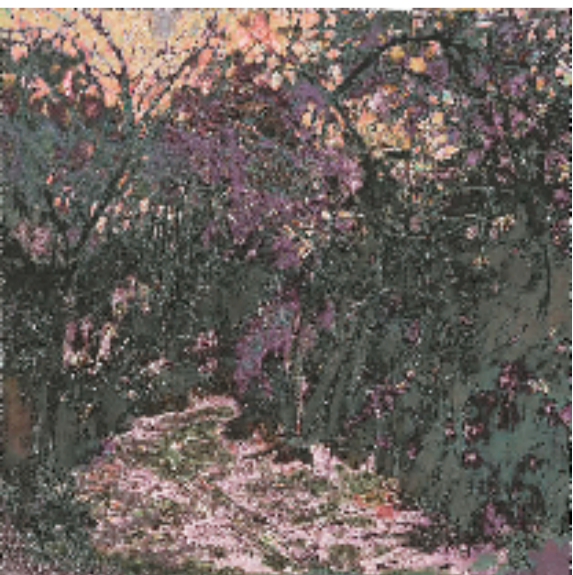
朱建高(广东韶关学院) 山地风 油画