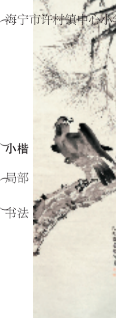
小楷 局部 书法