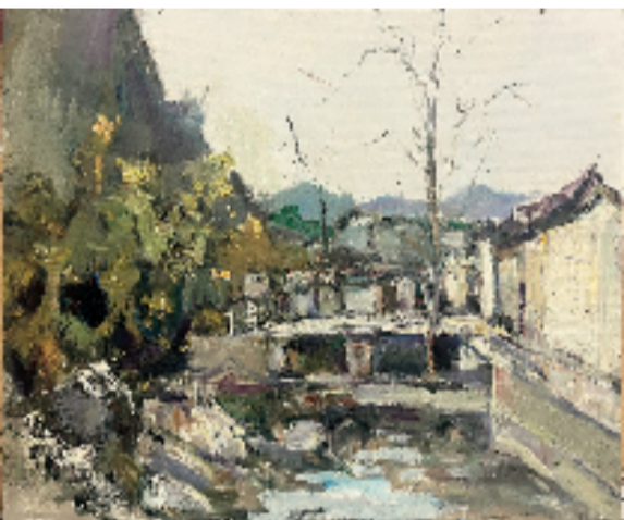
罗思齐(杭州师范大学美术学院本科生) 归乡处 油画