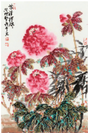
邢鸽平 Xing Ge Ping 芳菲醉色

邢鸽平,1955年生,河北海兴县人。现为浙江画院国家一级美术师、研究馆员、浙江省美协会会员、浙江中国画家协会理事、浙