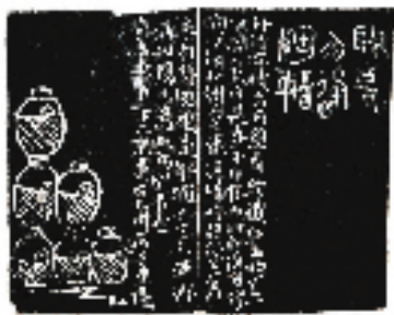
周强 篆刻 释文:开瓮勿逢陶谢(连款)