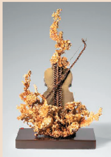
铜艺精品《情深东西》参与“从北京到巴黎——中法艺术家奥林匹克行”中国艺术大展。