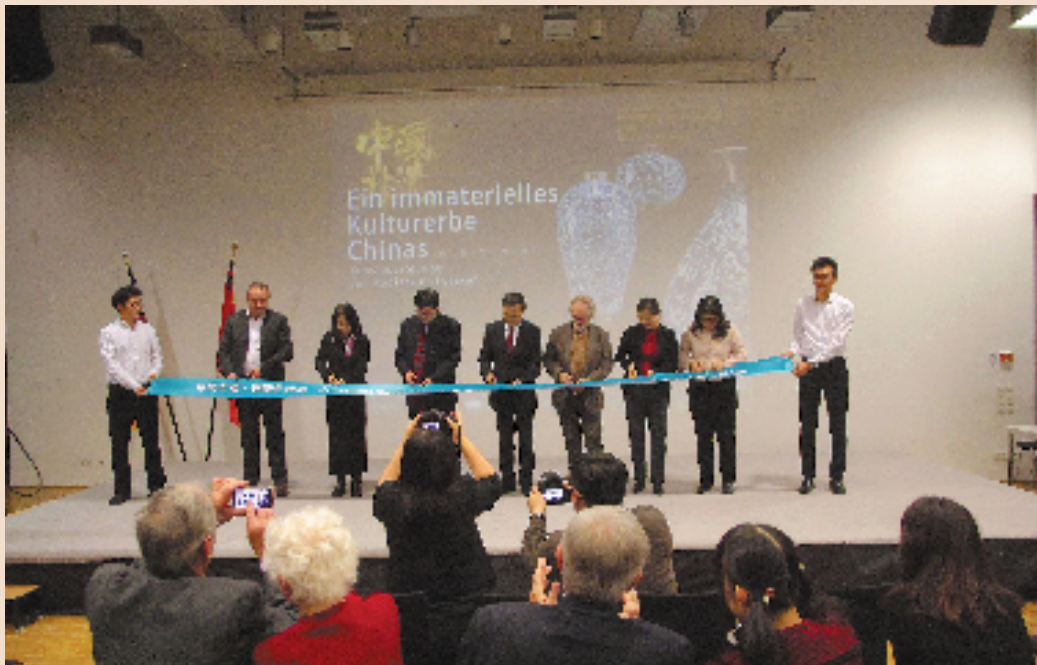
2018年12月,“中国非遗·铜雕艺术展”在柏林中国文化中心举办。