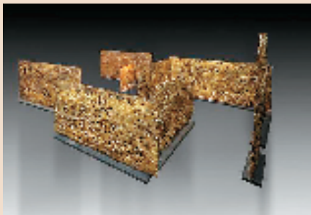
朱炳仁作品《宋画迷宫》参加威尼斯艺术双年展。