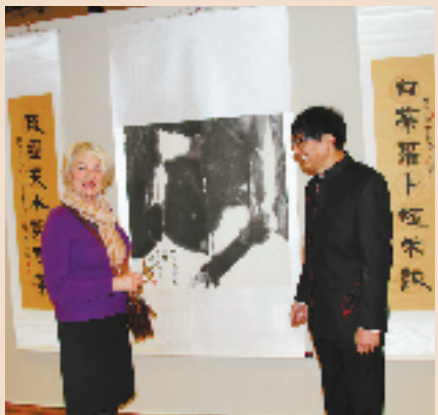
在卢浮宫举办的“中国书画艺术邀请展”上,展出朱炳仁的《沉重的水墨》《山水铜印》以及由《胜利女神》《维纳斯》《拿破仑》组成的《法兰西之魂》熔铜艺术品。