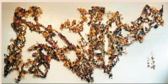
大型熔铜壁画《春和清妍》现收藏、陈列于新加坡中国文化中心大堂。