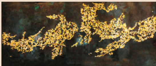
大型熔铜壁画《含熙》被泰国曼谷中国文化中心收藏。