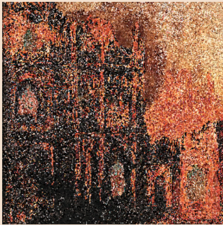
刘平(中国澳门) 大三巴印象 200×200cm 漆画 2023年