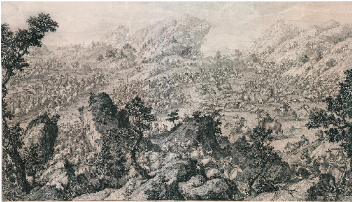
乾隆平定准部回部战图(阿尔楚尔之战) 91×52cm 18世纪 蚀刻雕刻铜版画