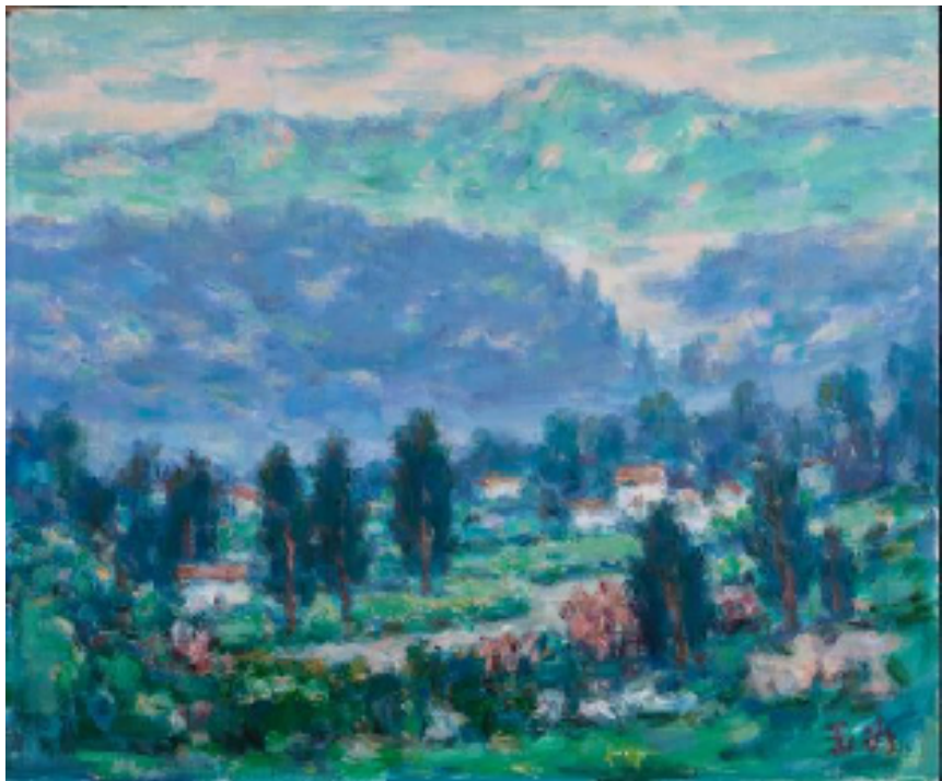
马玉如 川西途中 50x60cm 纸板油画 2011年