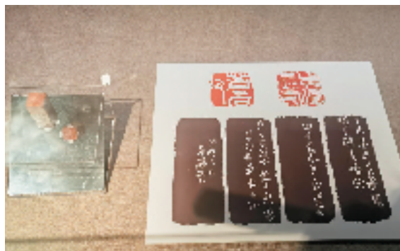
吴昌硕 篆刻(浙江博物馆藏)

吴昌硕是晚清近代中国艺坛承前启后的一代巨匠,诗、书、画、印四艺精绝,被誉为“石鼓篆书第一人”“文人画最后的高峰”。《吴昌硕传略及交游考》由著名学者、书法篆刻家朱关田先生所著,是一部对吴昌硕生平及其交游情况进行系统梳理和综合考察的学术著作,体现出一定的考据方法和学术视野。作者以“史学”为依归,旁征方志、谱牒,精思博考,厘订是非,解释疑滞。凡举一义,则确凿不刊。另,作者将艺术史研究与历史研究相结合,以期扩展诗、书、画、印研究的深度与广度,将艺术史学研究推向一个新的境界,为艺术史学研究确立了更好的视点奠定基础。全书史料宏富,考辨翔实,真实记录了吴昌硕为艺术的一生以及于诗文、金石、书画的学习渊源,对今日研究吴昌硕、研究“后海派”艺术乃至近现代学术史,均足资参考,真正体现了纪录一学者之平生,实亦一代学术之沉浮,确为嘉惠学林之作。此书由浙江摄影出版社出版。