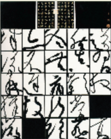
崔勇波 空白的韵律 167×133cm