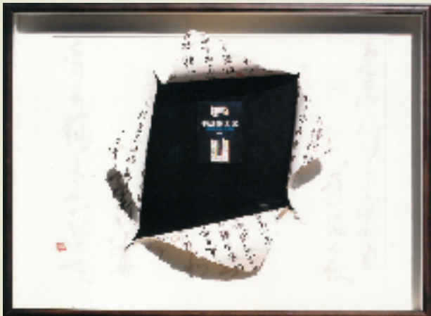
史培刚 突破 90×126cm

从2011年开始到2013—2016共六年三届奉行“学院派书法”教学与创作为主旨的“美术报陈振濂名家工作室”，是当时美术报名家工作室创办初始的开山之作。记得当时我联合何水法、吴山明两位先生面向社会共同作公益之举。后来动员北京范扬先生加盟，成名家工作室的四大支柱。记得第二届还有张立辰先生的重量级加入，当时的阵容之大，可见一斑。