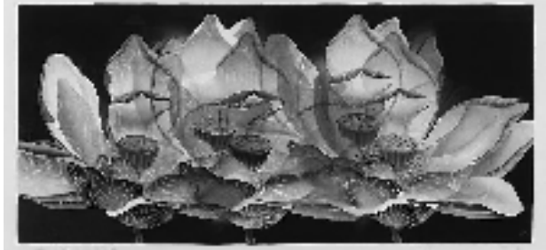
陈琦 不确定的真实 No.6 80x174cm 水印木刻 2017年

本报讯 通讯员 丁小艺 8月20日,“若有光——陈琦作品展”在安徽省美术馆开展。本次展览是艺术家陈琦近年来规模最大、作品媒介最为丰富的一次展览,涵盖了水印木刻版画、纸本水墨、纸艺装置、雕塑、新媒体空间装置等形式,共展出50余件代表性作品。