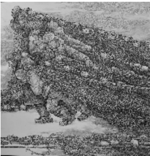
都立春 东北民生日记——冬网渔歌 227x227cm

同期,还举办“文明互鉴·一带一路”第二届图形印创新实践学术交流会。来自多个省市的专家、学者、作者围绕图形印项目后续的理论研究、教学开展、成果利用以及创作的形式、主题的广度深度等多方面展开学术交流。展览将持续至9月2日。