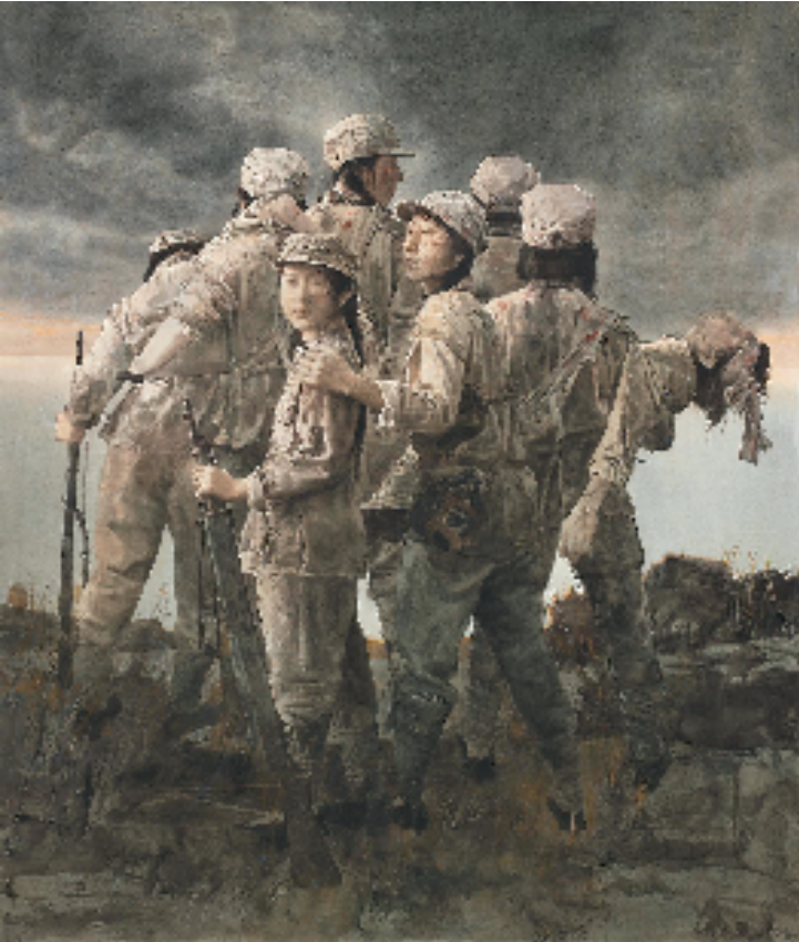
胡宝鑫(黑龙江) 乌斯浑河岸 180×150cm 水彩·粉画