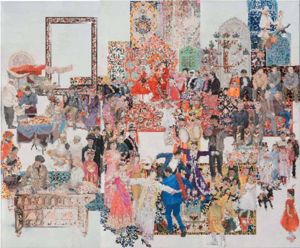
李丹 刘梓涵 刘睿 刘丽娟(北京) 美丽新疆 300×360cm 壁画