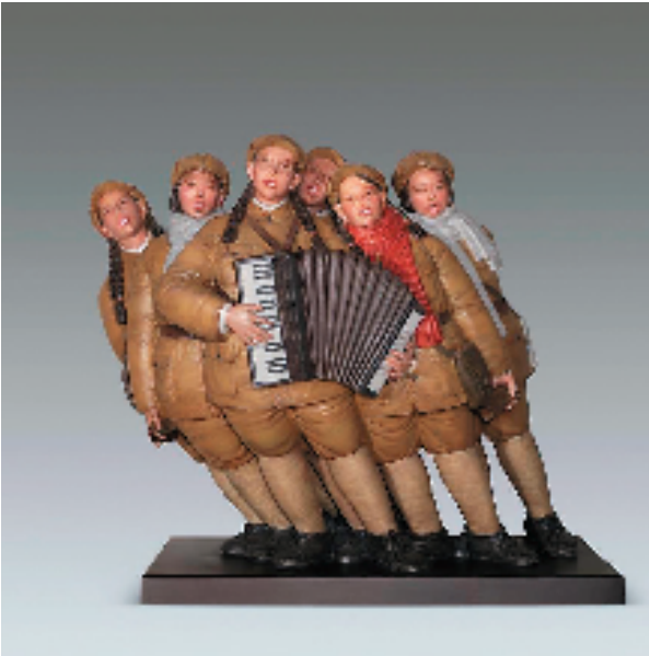
孙妍(吉林) 同唱 85×100×50cm 雕塑