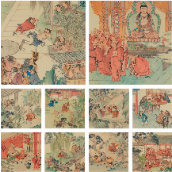
洪万里(浙江) 鲁智深 39×39cm×10 连环画