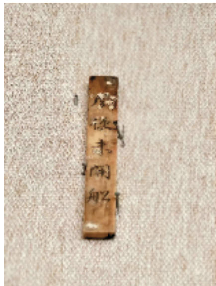
巢湖市博物馆展品“象牙筹”上的霉菌