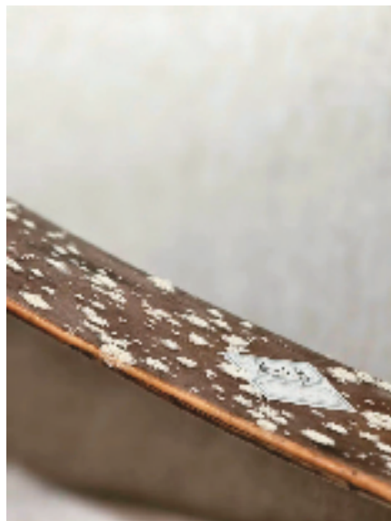
巢湖市博物馆展品“象牙笏板”上的霉菌

总之,要在法律允许的范围内,打破陈规陋习,大胆引入各方力量,努力创造不同机构合作的实验点,形成可行性的示范案例,以探寻文物保护、展陈、研究的最优途径;要让文物走出沉睡的状态,推动形成文物公布、保护、研究、展览的良性循环机制,在丰富文化事业的同时,走出先前文物单一保护的困境。