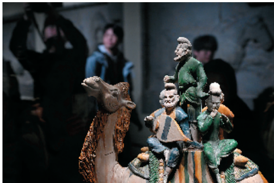
近年来,随着“文博热”持续升温,来博物馆看展览、看文物、感受灿烂辉煌的中华文明越来越受到广大观众的青睐。图为中国国家博物馆“古代中国”基本陈列现场。

近期安徽一博物馆展陈中暴露了一些问题引发公众热议。或是保护不力,出现文物发霉的情况;或是研究不足,对文物的定名语焉不详;或是展陈不佳,没有给出相应的、清晰完整的说明文字。