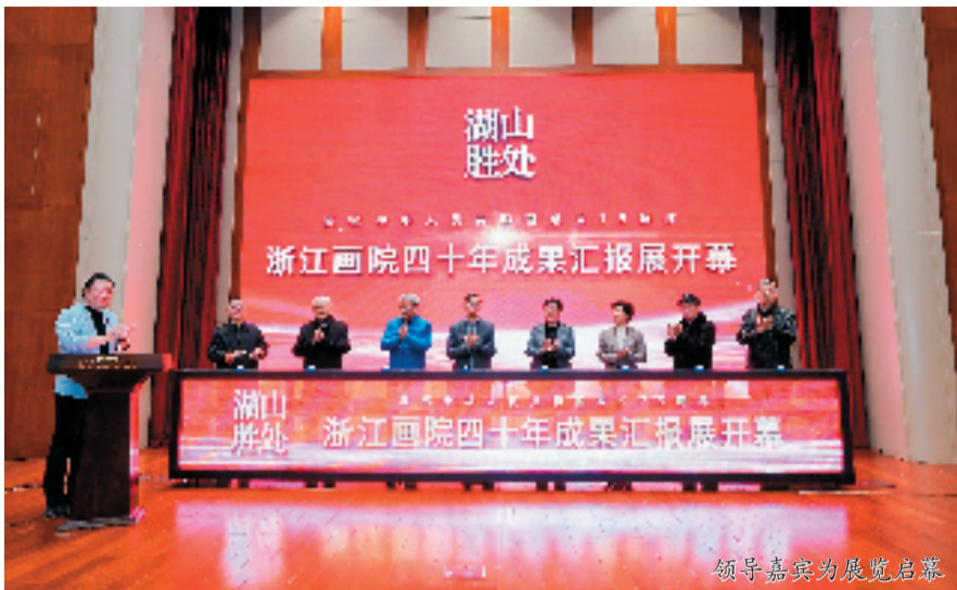
领导嘉宾为展览启幕