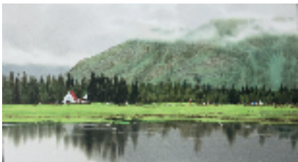
王巍 我的阿勒泰4 38x72cm 2024年