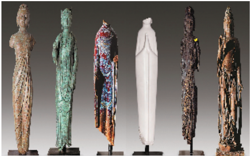
韩美林 永恒与瞬逝 高167-225cm不等 2011年

本次在广州艺术博物院(广州美术馆)的展览共展出作品300余件，分四个主题板块，引导观众步入韩美林的艺术花园。