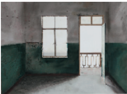
姚芳华 被遗忘的风景3 53x73cm 2019年