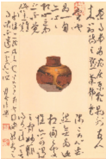
徐强 茶器题跋 30.5x20.6cm

本报讯 报艺 12月10日,由浙江省书法家协会、浙江书法院主办的“径山茶宴——徐强书法主题创作展”在浙江省文化馆开幕。本次展览是中国文联2024年度青年文艺创作扶持计划支持项目“径山茶宴”书法主题创作百品的结项展,由第二批“浙江省文艺名家计划”培育对象徐强担纲创作。 本展览以“径山茶宴”为核心主题,将书法艺术与传统茶文化深度融合,从书写形式、书体风格到材料运用与文本表达,展现了书法艺术在现代语境中的丰富可能。展览内容分为四大单元,书写主题依次为:茶器题跋:记录茶器之美与历史记忆;陆羽《茶经》:书写茶文化经典与哲思;径山祖师茶话:展现茶宴背后的禅意与文化遗产;径山祖师偈咏:融书法之韵于禅茶精神。展览不仅生动诠释“径山茶宴”这一文化符号的深厚内涵,更以书法为媒介,探索文化与艺术表达的共鸣。 据悉,展览持续至12月25日。