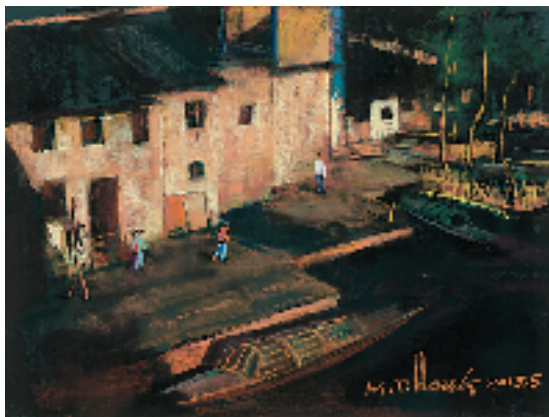
杭鸣时 柯桥夕照 57x78cm 2013年