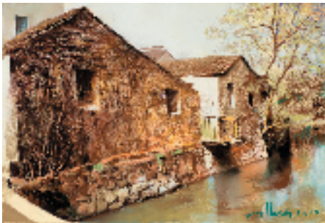
杭鸣时 冬去春来 54.5x79cm 2016年

杭鸣时先生将自己的所学、所思、所得、所创,身体力行地传导给年轻学子,生前提出重点培养推广在水彩粉画领域的十名青年艺术家。为传承先生精神,秉持先生教育理念,为青年水彩粉画艺术家搭建展示新平台,打造青年艺术家描绘时代精神图谱的新品牌,2023年11月起,苏州市公共文化中心策划实施“鸣于时代——全国青年水彩粉画艺术家推广计划”,时长五年,每年推出两位青年艺术家的双个展,并聘为苏州粉画艺术院特聘画家。此次展览上,该推广计划提名的10位青年艺术家的作品也同时亮相。