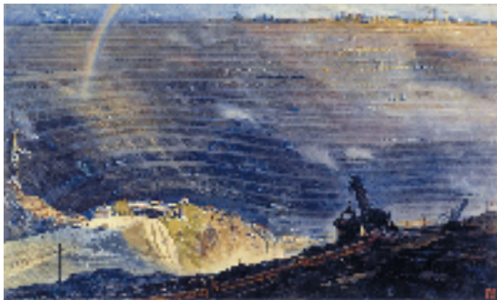
杭鸣时 工业的粮仓 52x86cm 1964年