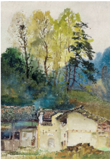
杭鸣时 井冈山象山窟 39x28cm 1976年