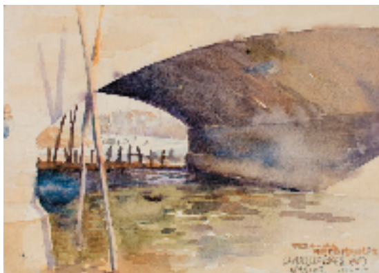
杭鸣时 桥洞 31.5x22.5cm 1954年