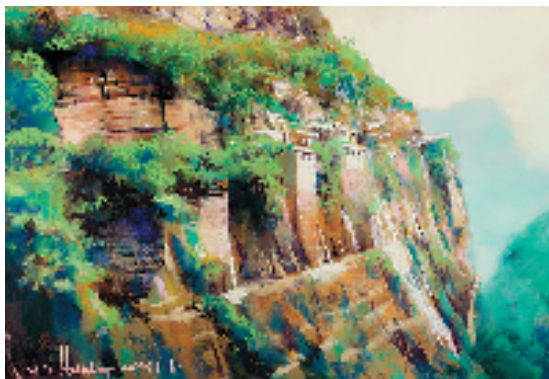
杭鸣时 悬崖居处仙人 54x78cm 2015年