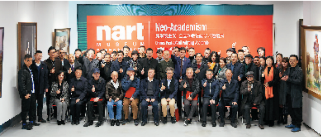
2020年12月，新学院主义全国70后油画学术邀请展

3.专业设施条件完备。该中心的基础建设扎实，前期已经过多年精心修建打造，设有多功能活动中心、展馆、马场、泳池、水系、草坡，观景平台等，能够满足不同人群的艺术活动和生活需求。