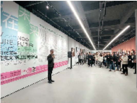
2022年12月，第一届 时代青年“新学院主义”架上绘画双年展