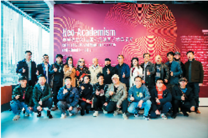
2021年12月，新学院主义全国80后油画学术邀请展