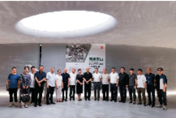
2022年6月，中国美院绘画艺术学院油画系下乡作品展在纳得美术馆巡展