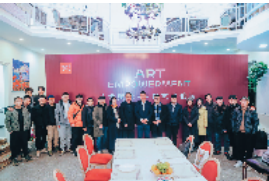
2023年12月，艺术赋能-纳得艺术论坛在纳得艺术庄园举办