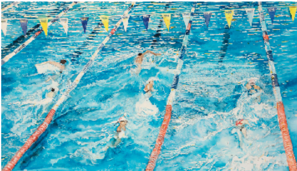
蓝之梦 53x76cm 水彩