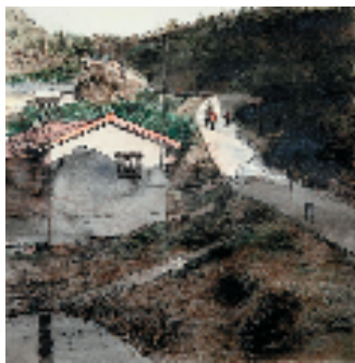
乡村小路 40x40cm 水彩