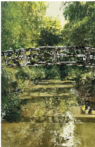
故乡的小桥 53x76cm 水彩