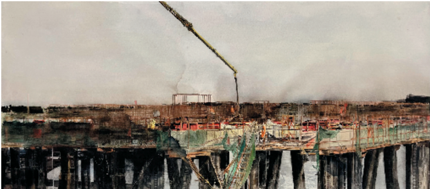
三峡枢纽白洋港路港铁路建设 55x122cm 水彩