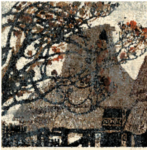
朱维明 傣家拾趣·雨润如酥 45x45cm 1985年 浙江美术馆藏