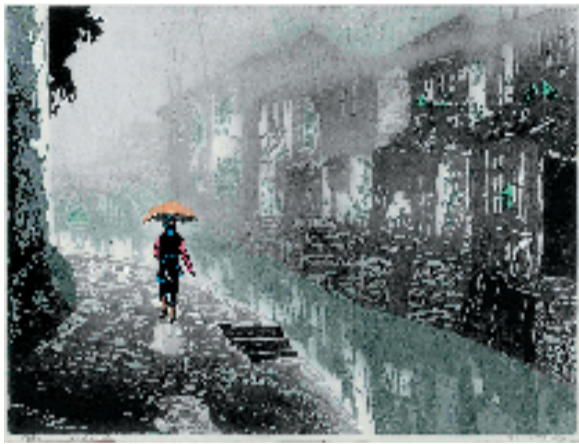
甘正伦 春雨江南 45x60cm 1994年 浙江美术馆藏