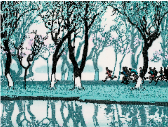
陆放 苏堤春晓 40x53cm 1973年 杭州国家版本馆藏