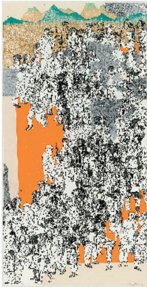
方利民 乐游图 138x69cm 2021年