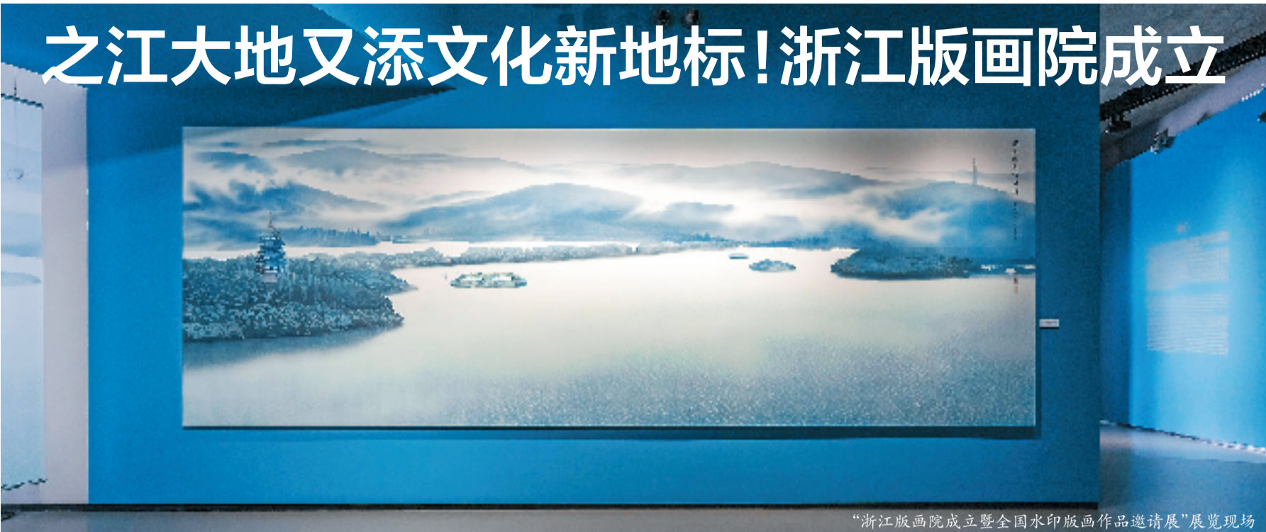
“浙江版画院成立暨全国水印版画作品邀请展”展览现场