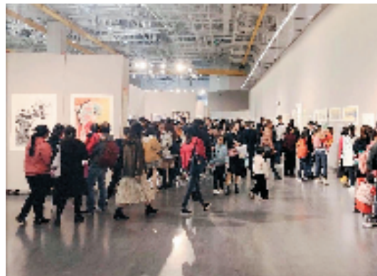
展览现场人山人海，反响强烈

赛事是促练创新，展览则是最好的观摩互鉴。每年一度的优秀作品展是对孩子们辛勤付出的最好馈赠，是孩子们对老师、对父母的用心培养最好的汇报！展览本身是一项庞大而繁杂的工程，每年从全省众多的优秀作品中逐件筛选、统计，到装裱、布展，再到首展、巡展等事无巨细，工作量巨大，但福建考区始终不忘初心，秉持“努力用专业的美育精神给孩子们搭建一个高水平展示平台”的信念办好每一次展览，这是对美育热爱的再次聚首，孩子们的作品主题积极向上，创作形式新颖独特，处处洋溢着青春的阳光活力，是精妙绝伦的作品欣赏，更是以展促学，以画促教，教学相长的砥砺前行。