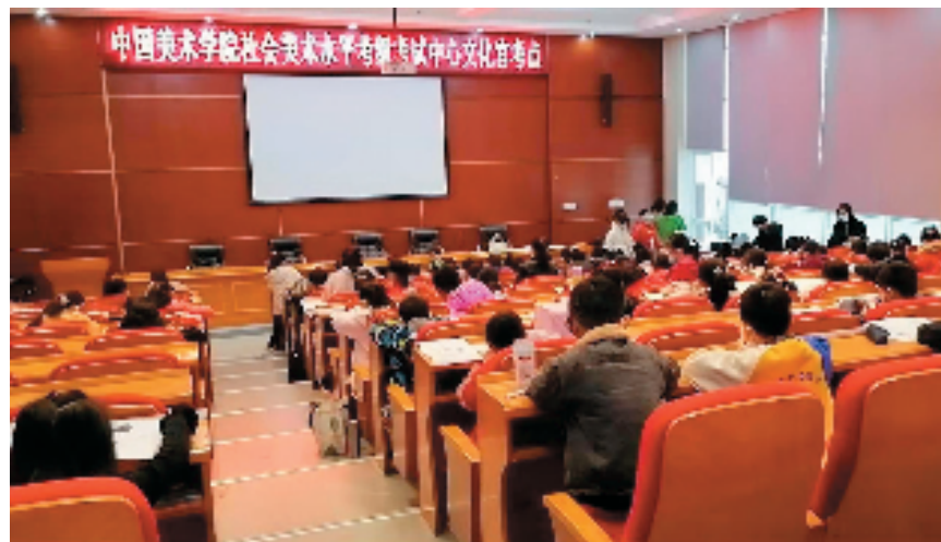
厦门市总工会考级现场

中国美术学院作为一所久负盛名的世界十大美术学院之一，其美术考级于2003年由中华人民共和国文化部文教科函[2003]627号批复，在全国范围内为广大师生提供规范性、专业性的阶段性美育测评，而位于碧海蓝天的福建省鹭岛厦门的中国美院美术考级福建考区，十几年来美术考级工作始终走在全国前列，建立了一支庞大的优秀专业团队，考点覆盖福建省内9个地级市，85个县级（45县、14市、26区），达400多个考级分点，包括福州市青少年宫、厦门市青少年宫、莆田市青少年宫等福建省内的各青少年宫，妇女儿童培训中心等均为福建考区考级单位，福建考区始终一如既往地本着为大闽推广和普及美术教育为己任，工作流程管理规范有序，考点作品质量高，得到了中国美术学院专家评委组的一致好评，屡次被中国美术学院考级中心评为全国先进单位。