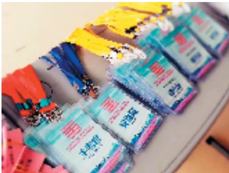
配置齐整的监考官、安保、考场引导员等，确保赛事安全有序地进行