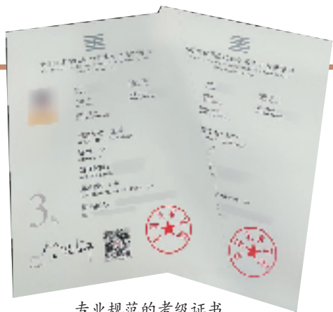
专业规范的考级证书