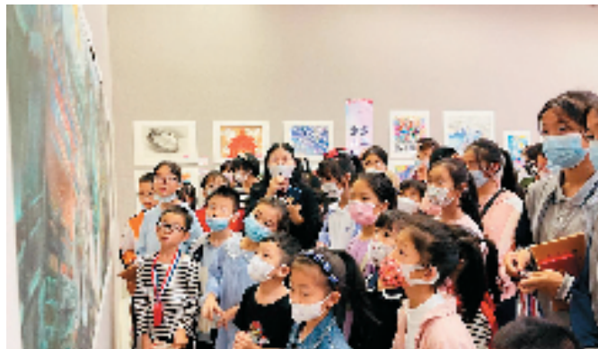
老师为学生们做现场讲解与学习，每年参观者均络绎不绝，且常有