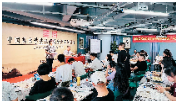
师训现场的答疑解惑