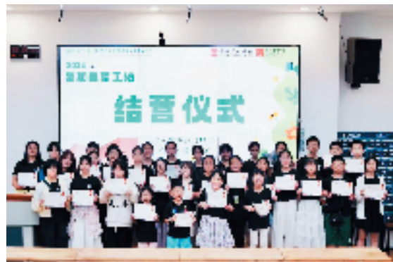
中国美院美育工作坊结营仪式

“让艺术的种子在孩子心田发芽，让孩子遨游艺术与梦想的世界”，在当今跨学科视域下，美育不应局限在单一纬度，如何让孩子们在探索与研究的基础上学习；如何让美育具备解决现实问题的创新办法；如何将美术表现与科学思维落入到生活中；如何将“知行合一”转化到美育实践中，福建考区始终在以新时代的视野不断探索着，除了积极为孩子们搭建专业的展赛平台外，更是秉承中国美院倡导“多元互动，和而不同的”学术思想，发挥考区自身优势，积极为考点师生挖掘、研发优质研学活动，力求在丰富的美育研学实践中，浸润心灵，研有所学，行有所获。