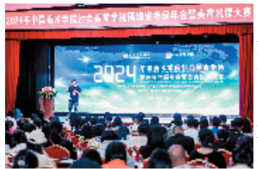
精彩纷呈的美育说课大赛

当下，无论是个人、学校、社会还是国家，对美育的认知和实践都已取得突破性发展，我们迎来了一个美育发展的大时代！