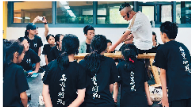
同学们认真观摩美院老师的讲解示范