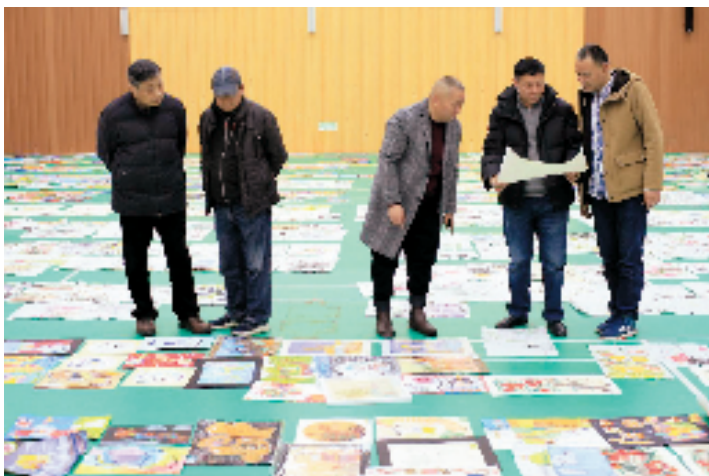
专家评委评选现场

如果说考级是阶段性学习的成果检测，那么美育赛事则是一场专业创作的响亮汇报。中国美院美术考级福建考区一直以来始终以“如何能不断激励福建省青少年儿童对书画艺术的兴趣爱好并不断提升专业水平，如何为各机构搭建专业平台，不断提高办学水平”作为指导思想与工作信念，多年来，各考点单位均能与考区形成高度一致的认知共识，积极组织参加相关美育赛事，以赛促练，共同携手为孩子们搭建具有专业高度的展赛平台。通过多年的探索、实践与积累，已形成“赛事征稿——初评入围——现场复赛——确认真伪——专家评选——专业展览——颁奖典礼——专辑、专刊——宣传推广”等完善的赛事组织程序与能力，相信福建考区的美育赛事将继续呈现专业、俱进、互动创新的展赛格局，并不断拓展新维度，创造新高度！