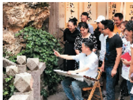
让老师们受益匪浅，专家导师生动的现场教学

为此福建考区积极主动，科学规划，分阶段、分批次开设相关学科专项培训，培训内容涉及国画、色彩、素描、软硬笔书法、儿童画、动漫等与一线教师教学紧密契合的专业学科，邀请知名专家作为培训导师，通过与专家导师们的零距离学习、系统专业化的训练，创新教学模式，为进一步规范和完善福建考区美育人才的储备、培养、评价和展示奠定了良好的基础，用一名合格的美育工作者的身份，深化美育理论、践行美育精神、倡导美育信念、构筑美育时代。