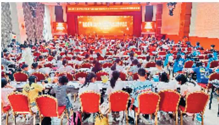
参赛选手们在各个赛场认真投入地创作