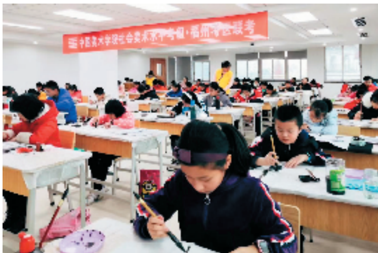
福州考级联考现场