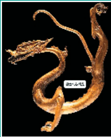
唐代鎏金铁芯铜龙

汉墓壁画和帛画中常见人首蛇身的伏羲和女娲交合在一起的画面,新疆吐鲁番阿斯塔那墓地出土的唐代伏羲女娲图【如图】。画面表现的就是伏羲、女娲交尾情景。伏羲、女娲作人首,上身相拥,下身作蛇身相交,伏羲持规,女娲持矩,代表着天圆地方。这说明蛇崇拜的主