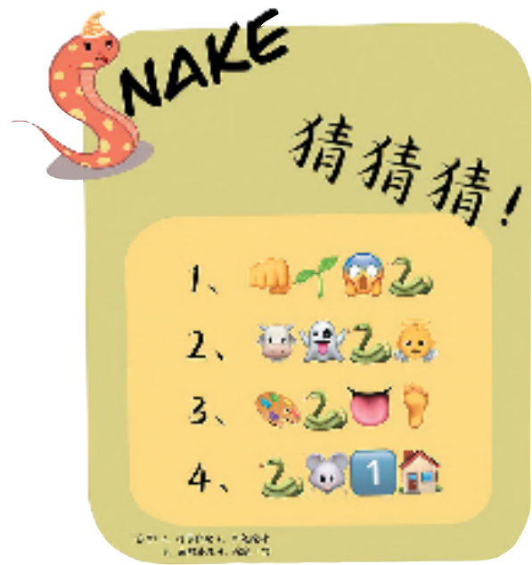
答案: 1. 蛇身直上 2. 牛角蛇身 3. 蛇头添足 4. 蛇尾一翼