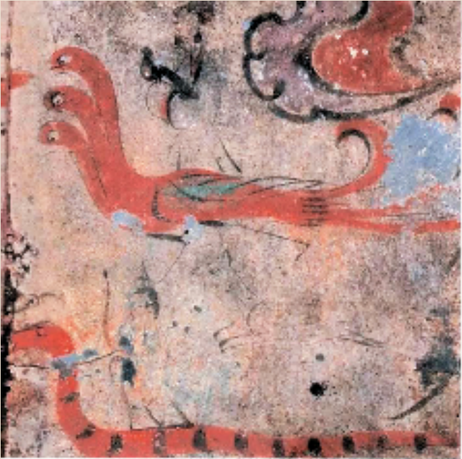
西汉 卜千秋墓主室脊顶壁画(墓主夫妇升天)(局部) 洛阳古墓博物馆 壁画