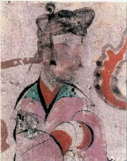
西汉 卜千秋墓主室脊顶壁画(女娲)(局部) 洛阳古墓博物馆 壁画