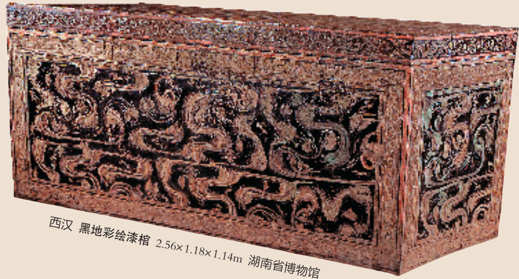
西汉 黑地彩绘漆棺 2.56x1.18x1.14m 湖南省博物馆

蛇,这一古老而神秘的生物,自古以来便在人类的文化和信仰中占据着举足轻重的地位。汉代更是盛行“事死如生”的丧葬观念,人们深信人死后灵魂将步入另一世界继续生活。因此,在这具漆棺上,我们看到了那些既非羊又非虎、头戴长角、身披兽尾的神秘怪物,它们很可能便是墓主人的忠诚守护者,确保墓主人的灵魂在另一个世界得以安然无恙,肉身免受侵扰。(作者为浙江师范大学研究生)