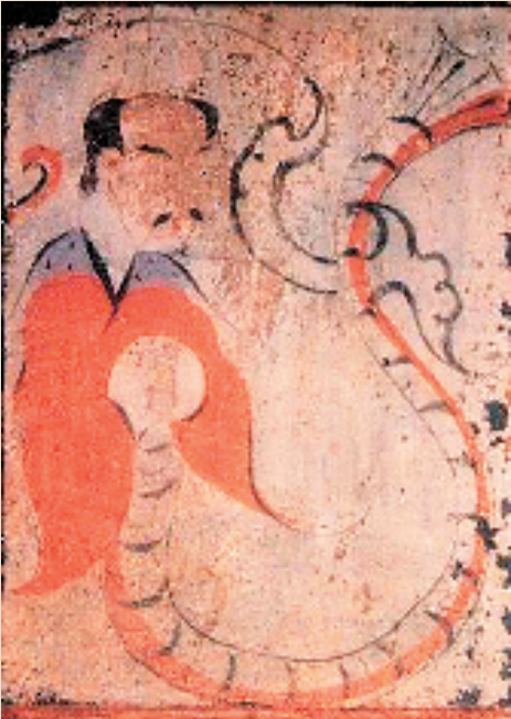
西汉 卜千秋墓主室脊顶壁画(伏羲)(局部) 洛阳古墓博物馆 壁画