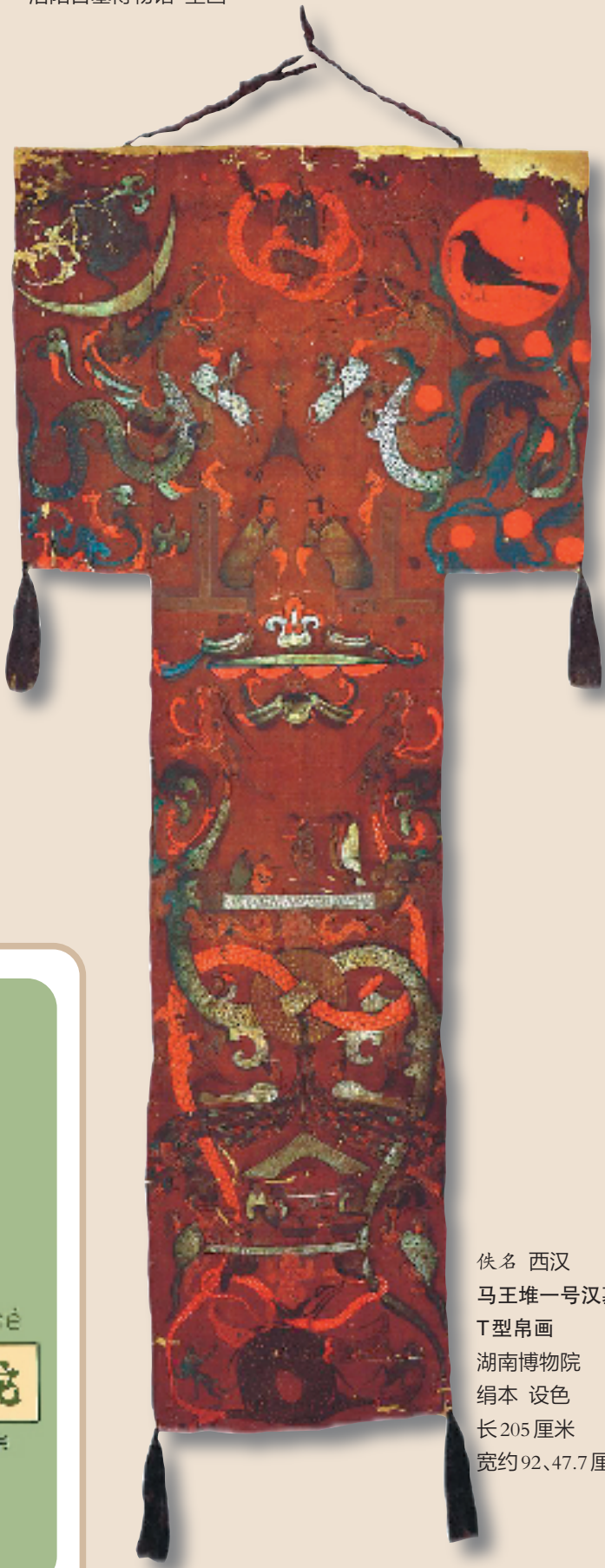
佚名 西汉 马王堆一号汉墓 T型帛画 湖南博物院 绢本 设色 长205厘米 宽约92、47.7厘米