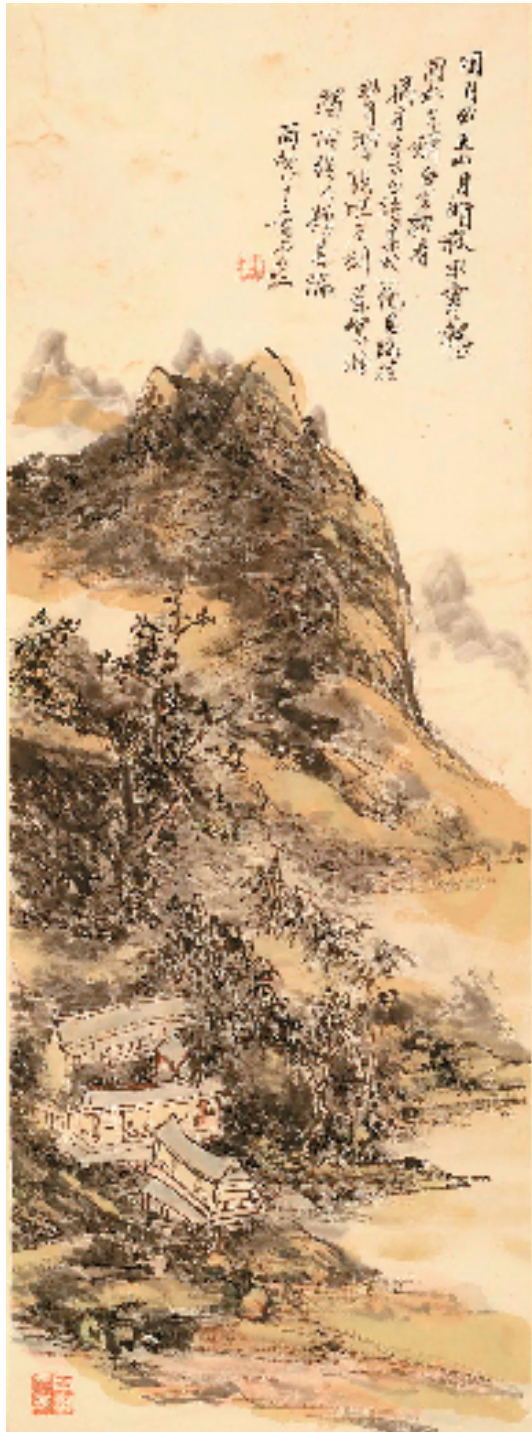
黄宾虹 临桂水月洞图轴

此外,还展出了黄宾虹珍贵的文献手稿、友朋信札等。据悉,展览将截止至 6 月 8 日。