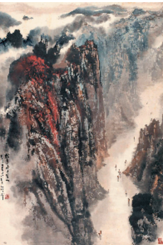
宋文治 轻舟已过万重山 87×60cm 1980年

本报讯 通讯员 曹莺倩 适逢宋文治先生诞辰 105 周年,由深圳美术馆主办,宋文治艺术馆(太仓名人馆)、深圳市公共文化艺术创作中心(深圳画院)协办的“轻舟已过万重山——宋文治先生诞辰 105 周年深圳特展”于 1 月 1 日—4 月 6 日在深圳美术馆(新馆)举办。