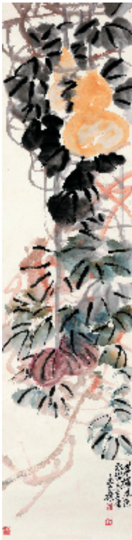
吴昌硕 茅檐风色 143×34.5cm 设色纸本

本报讯 通讯员 顾宁宁 “‘何为海派·海上名家’艺术系列大展:海上明月·纪念吴昌硕诞辰 180 周年艺术大展”于 2024 年 12 月 31 日在中华艺术宫(上海美术馆)开幕。