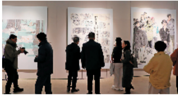
万年浦江展览现场