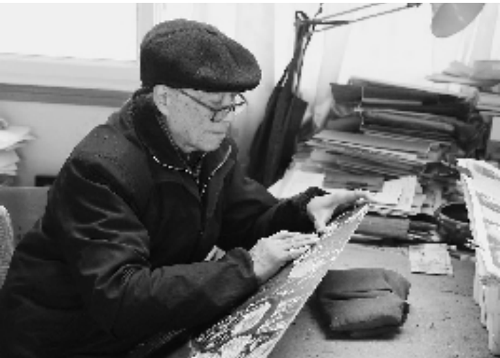
2009年,赵宗藻在创作浙江省重大历史题材作品《钱塘春暖》

本报讯 苏国 版画家、美术教育家、浙江省版画家协会名誉主席、中国美术学院原副院长、教授赵宗藻先生于2024年12月27日18时58分在杭州逝世,享年93岁。其告别仪式定于1月4日上午10时在杭州殡仪馆追远厅举行。