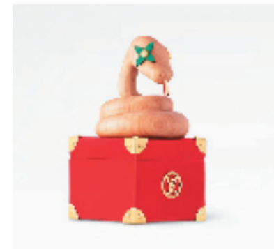
1 Louis Vuitton(路易威登)