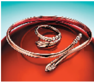
Tiffany & Co.(蒂芙尼)