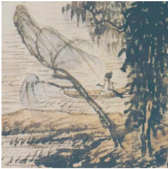
泛舟山水图（之五局部）