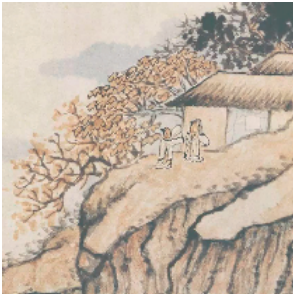
陶潜诗意图（之一局部）