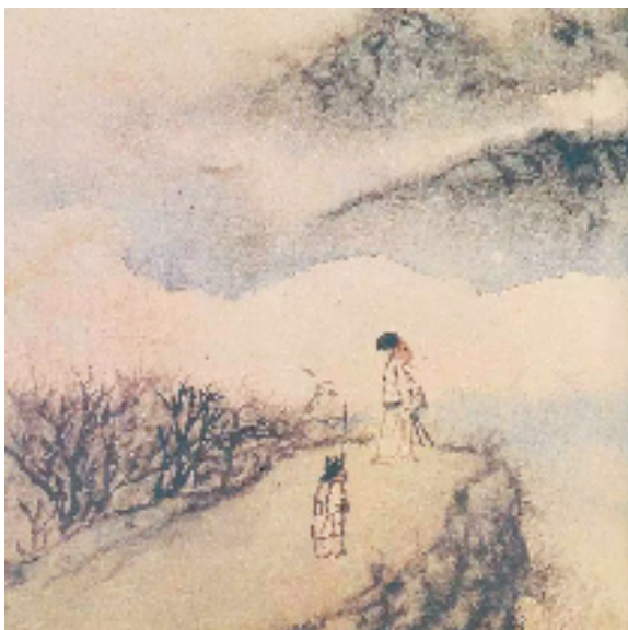
黄砚旅诗意图（之一局部）