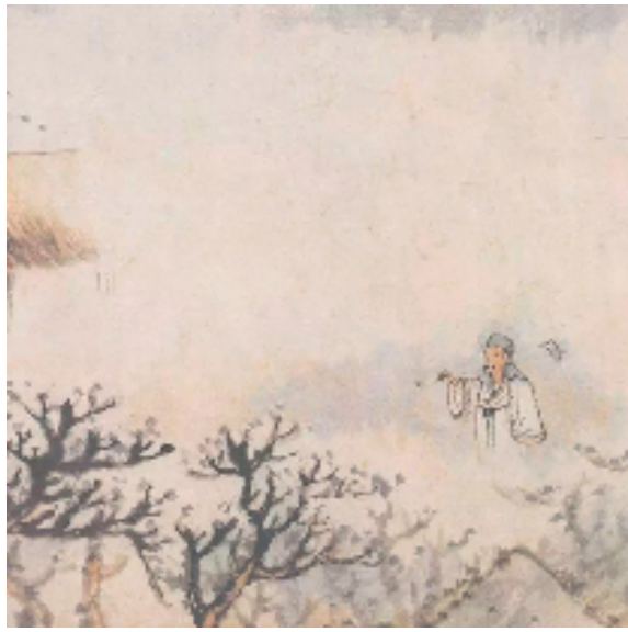
陶潜诗意图（之六局部）