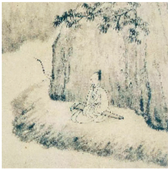
山水花卉图（之四局部）