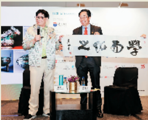
朱炳仁与“艺文香港”策展人焦天龙现场对话

朱炳仁凭借这些极具开创性的作品和展览，在青铜文明史上刻下不可磨灭的印记。他用独特视角、精湛技艺和创新精神，赋予青铜艺术全新的生命力和时代价值。尤其是他发明的熔铜艺术，彻底改写青铜艺术的创作规则，让青铜艺术在当代社会绽放出前所未有的光彩。他的名字，成为当代青铜艺术的一面旗帜，激励着全球无数艺术家在传统与现代、东方与西方的交融中探索前行，让青铜这一古老艺术在新时代不断焕发出新的活力，在世界艺术之林持续闪耀独特光芒。