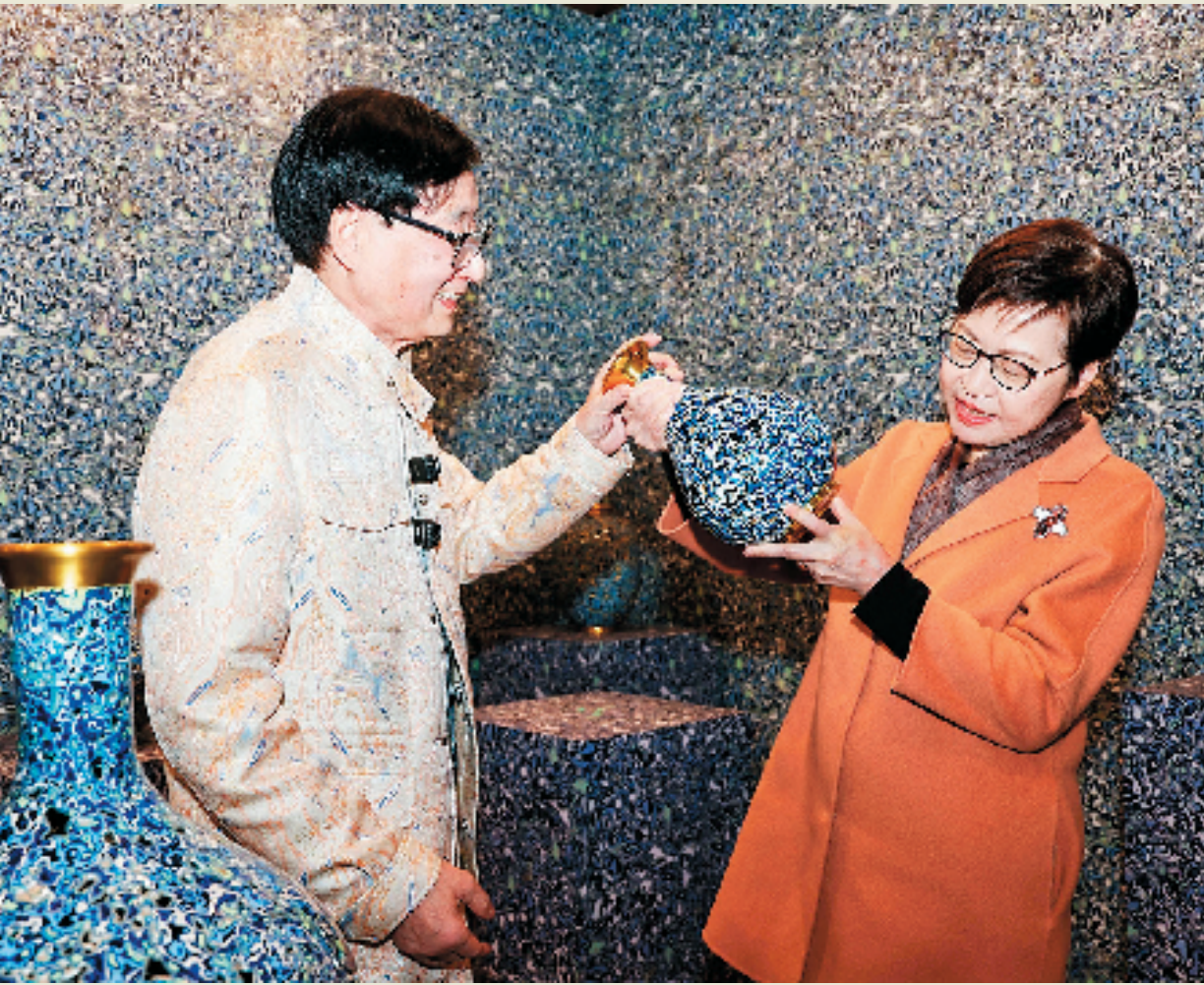
朱炳仁为林郑月娥讲解《铜青花》

青铜艺术贯穿人类文明史，承载着厚重文化。从东方商周的庄重礼器，到西方古希腊、古罗马的精美雕塑，虽跨越地域与文化，却始终散发独特魅力。然而岁月漫长，多数青铜创作者的名字被历史尘封。直到朱炳仁出现，他凭借非凡创造力与卓越成就，成为青铜文明里首个被全球艺术界熟知的标志性人物，为古老青铜艺术注入活力，架起东方传统与世界艺术潮流的桥梁。