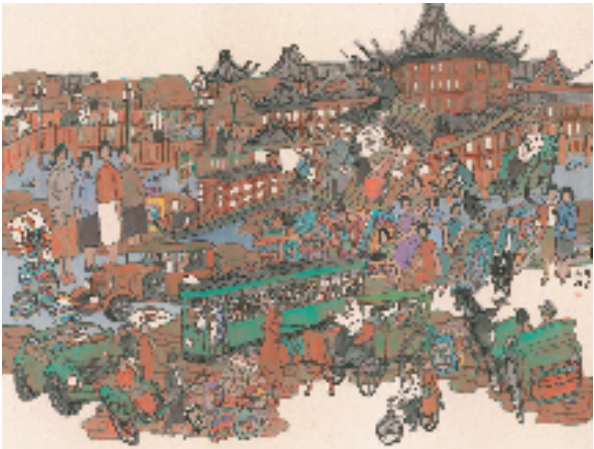
周矩敏 海上尘烟一豫园 123x163cm 中国画 席、苏州国画院名誉院长、享受国务院政府特殊津贴。

本报讯 记者 黄俊娴 日前,“象外之象——2015—2025周矩敏新作展”拉开帷幕。此次展览由江苏省中国画学会、苏州市文化广电和旅游局主办,苏州市公共文化中心(苏州美术馆)承办,苏州国画院支持。 展览不仅展示了周矩敏近十年的艺术探索与转型成果,更为观众呈现了一场跨越时空、融合中西的艺术之旅。从《大先生》对民国大师的深刻刻画,到《丝绸之路》对历史文化的传承与创新演绎,再到《海上尘烟》的奇幻想象、《异域风情》的独特视角以及《园林人物》的熟悉韵味与新变,每一系列都凝聚着艺术家的心血与智慧。五大系列近百幅新作品,将持续展至3月16日。 周矩敏,江苏苏州人。中国美术家协会会员、国家一级美术师、江苏省中国画学会副会长、江苏省高级艺术职称评委、苏州大学艺术学院硕士生导师、苏州美术家协会名誉主