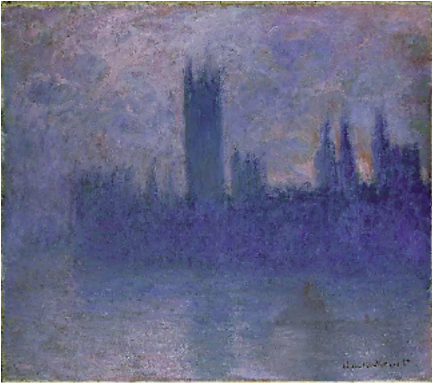
1900年 POLA美术馆藏 克劳德·莫奈(1840-1926年) 国会大厦·玫瑰色交响乐 布面油画