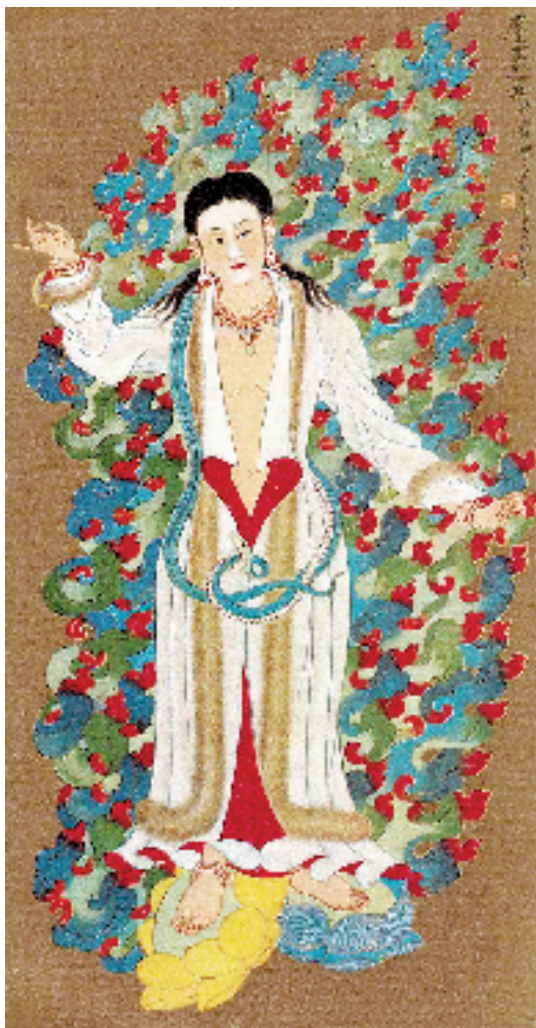
张大千 摩登伽女 1953年

整幅作品通过工笔重彩, 运用细劲圆润的铁线游丝描和行云流水描, 以及丰富的色彩和细腻的笔触, 将人物珠圆的容颜和高雅的姿态表现得淋漓尽致, 用笔精细飘逸, 线条清秀劲健, 笔意圆转起伏, 刚中带柔, 凸显人物神态安闲、妙法莲花之相。设色敷染醇厚, 使用浓艳而又沉稳的朱砂和石绿, 勾染浸润, 却又浓而不妖, 艳而不俗, 刻画出人物呈半透明状的肌肤质感, 描摹工谨, 华丽中不失恬淡, 尽显盛唐遗风, 古意盎然, 兼具现代意味的审美情趣, 赋予画面强烈的动态质感和生命活力。